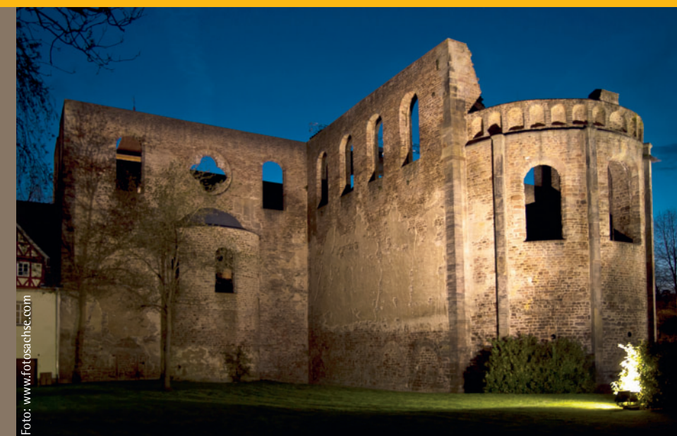
Stiftsruine Bad Hersfeld