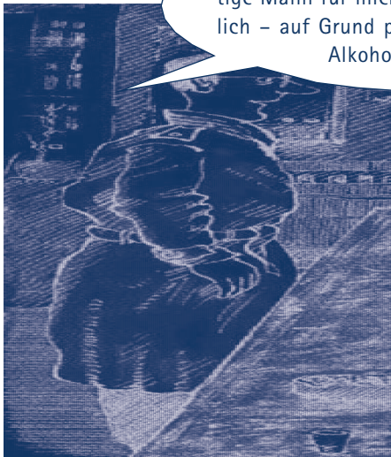
Abbildung 6: Karikatur Freimut Wössner, „Möönsch“, 1992

Die Geschichte eines Patienten unserer Therapiegruppe verdeutlicht diese Zusammenhänge: